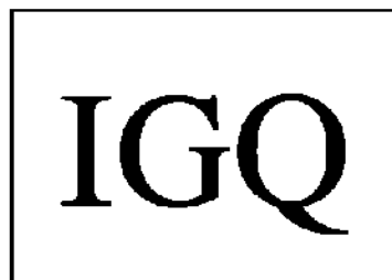
Figura 4: Marchio di certificazione IGQ di prodotto per i prodotti ottenuti per stampaggio o pressofusione