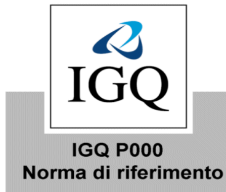
Figura 2: Marchio di certificazione IGQ di prodotto